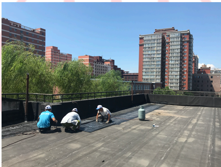
▲ 北园 2 楼屋面防水工程正在进行

为了做好屋面防水，经国内公寓部北园公寓联系、协调，北园 2 楼于 7 月 26 日开展了屋面防水施工工程，为避开汛期带来的施工影响，期间加紧作业、尽量缩短工期，在各方的共同努力下，于当日完成了主要防水工程。