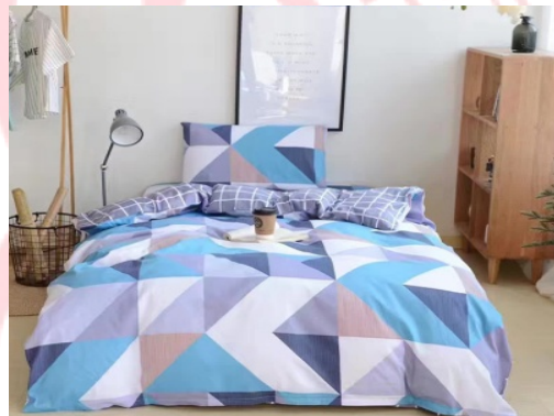
▲ 微人大卧具预订服务