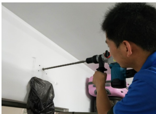
▲ 网络工程打孔进行时

作，整合人员周末连续奋战，全程配合施工入室，克服噪音、灰尘等影响。施工期间发现的线路短路、动火安全等问题，做到了及时发现、有效处理，确保了无线网改造工程高效有序开展。