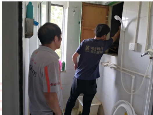
▲ 工作人员正在为隐蔽区域灭蟑