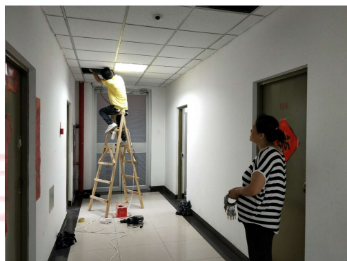
▲ 全程配合施工，图为布线作业