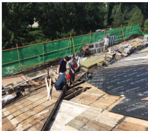
▲ 红楼顶层屋脊瓦更换及防水工程